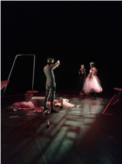
Photo de répétitions