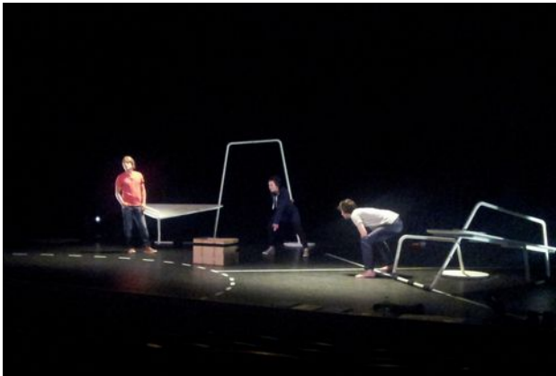
Photo de répétitions

Théâtre - Création 2014 - Tout public à partir de 9 ans - 1h